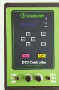
V1.8 Modell-Nr.: ALS0049