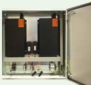
1000W 2-Kanal Bestell-Nr.: ALS0006