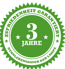
Garantiezeit gerechnet ab Herstellungsdatum.

Erforderlich für die Installation von ALIS-LED Lichtrohre in Ihrem System: