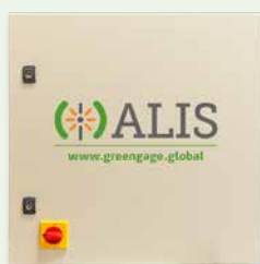
500W 1-Kanal Bestell-Nr.: ALS0010