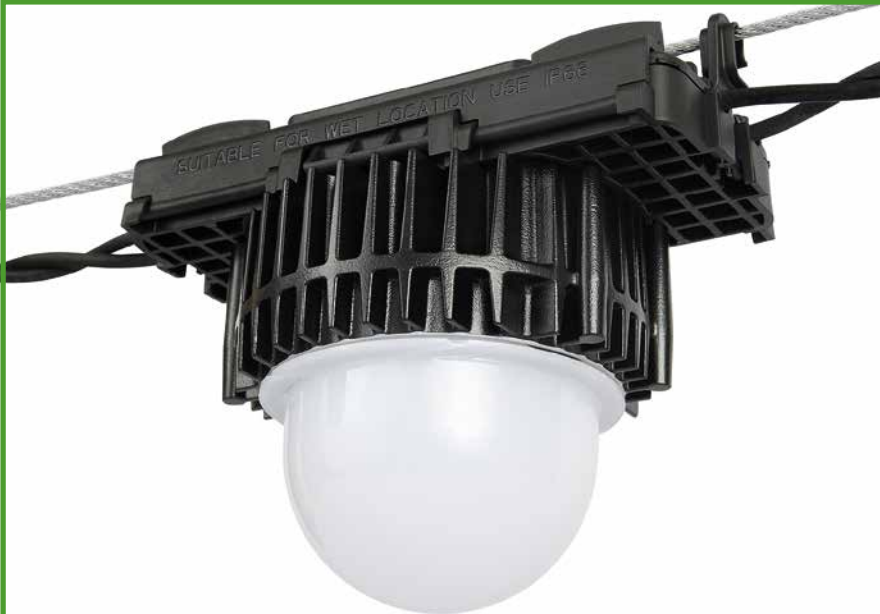
Lámpara para granjas ALIS de haz ancho (ALS0003)