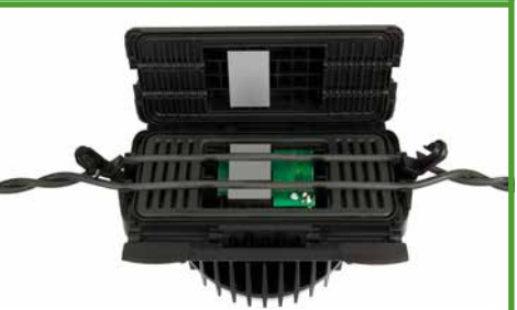
Potencia inductiva patentada ALIS