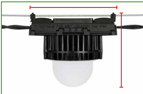
Longitud y profundidad