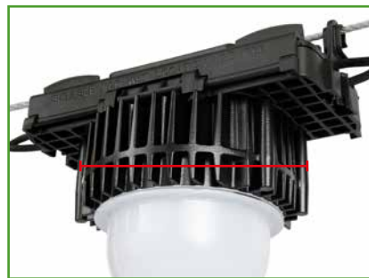
Anchura (diámetro del disipador de calor)