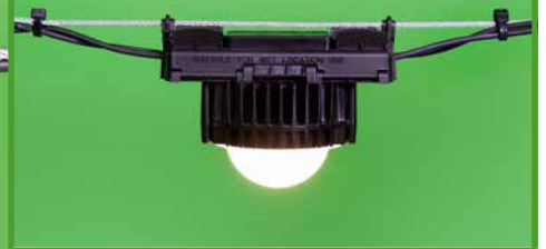
ALIS-Stalllampe, breitstrahlend (ALS0001)