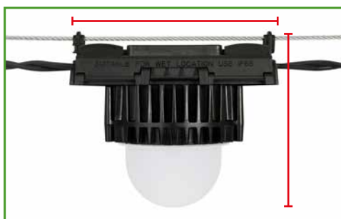
Länge und Tiefe