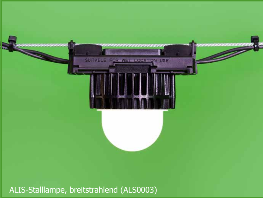
ALIS-Stalllampe, breitstrahlend (ALS0003)