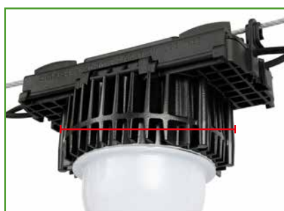
Breite (Durchmesser Kühlkörper)