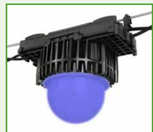
โคมไฟสีน้ำเงินอะลิส หมายเลขรุ่น: ALS0017 โคมไฟสีน้ำเงินอะลิสจะสร้างสภาวะของความสงบเย็นเยือกเย็นให้แก่ ภายในโรงเรือนสัตว์ปีก สำหรับช่วงเวลาของการจับสัตว์ปีก