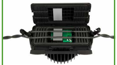
พลังงานเหนียวอะลิสที่ได้รับการจดสิทธิบัตร