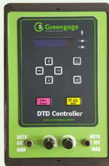
ตัวควบคุมดีทีดีแบบดิจิทัล V1.8 หมายเลขรุ่น: ALS0049