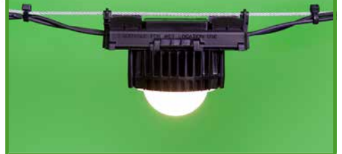
โคมไฟลำแสงมุมแคบอะลิสสำหรับโรงเรือน (ALS0001)